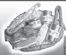
RESTAURATION • BUVETTE