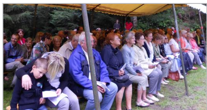
Bien installés, les paroissiens ont célébré Saint-Martin au cœur du vallon.