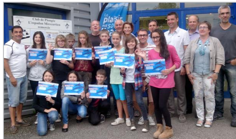
Le club de plongée de l'Espadon a offert des baptêmes et des diplômes aux jeunes du jumelage.

Le lendemain tout le monde s'est dit au revoir sur le parking de la mairie en attendant de se revoir en octobre à la foire de Pütchen à Beuel.