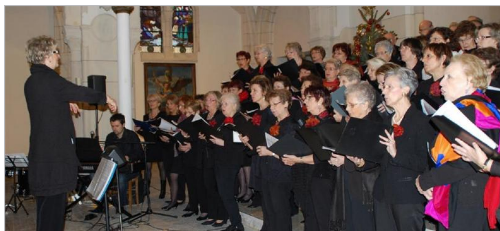
Les chorales se produiront en l'église Saint-Michel, lundi.