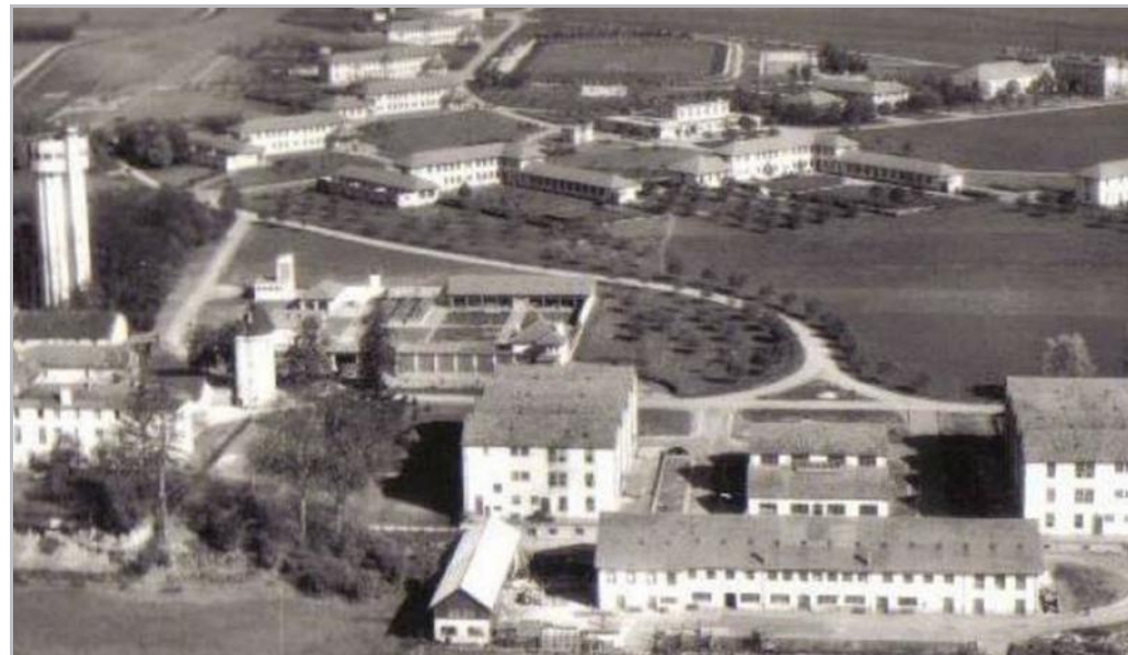
Pendant la Deuxième Guerre mondiale, l'hôpital de Ravenel s'est tour à tour transformé en parc à matériel, en camp de prisonniers, en hôpital allemand puis en hôpital américain.

De juin 1940 à février 1941, après la débâcle, le site de Ravenel devient un camp