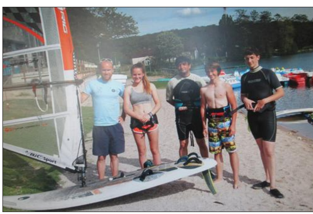
■ L'équipe de compétition s'est bien classée au dernier stage à Port-Grimaud.