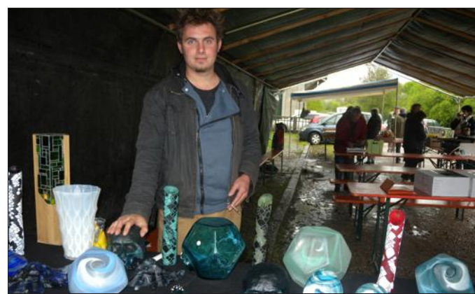
■ Un artisan du verre, issu de Vannes-le-Châtel.

Installés sous chapiteau sur la place des Bosquets, de nombreux artisans et commerçants proposaient leurs produits à un public réduit composé en majorité d'habitants de Maron venus soutenir l'initiative de l'AFR. L'offre était diversifiée et colorée,