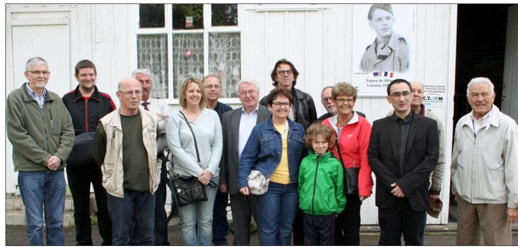
■ L'espace vient d'accueillir ses premiers visiteurs internationaux.